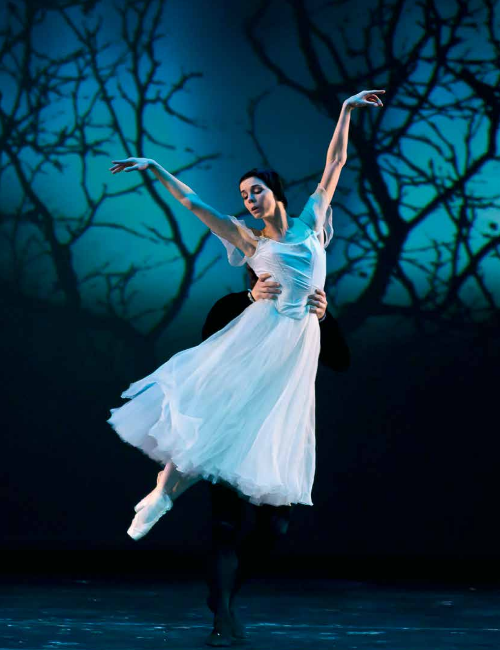
Наталья Осипова и Иван Васильев в Жизель.