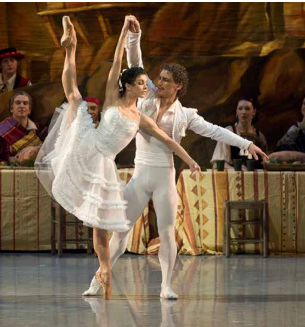
Наталья Осипова и Иван Васильев в Laurencia.

Осипова: Возможность работать в других труппах и строить карьеру так, что я могу танцевать и в Петербурге, и в Нью-Йорке, и Милане - жизнь очень разнообразная. Каждый месяц несет изменения, и это хорошо и необычно. Я очень рада, что моя карьера развивается в этом направлении.