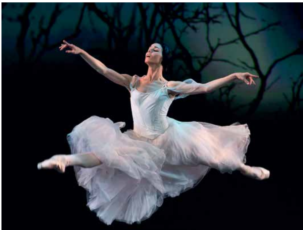
Наталья Осипова в Жизель.